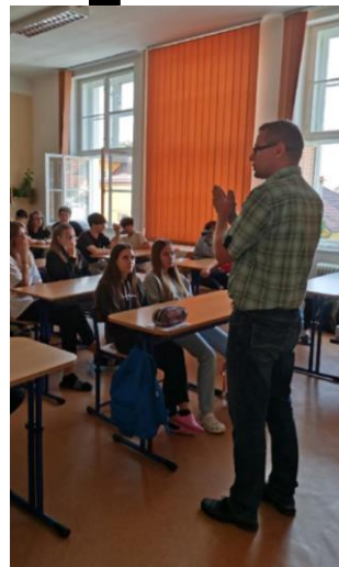
Návštěva SOŠ Strážnice