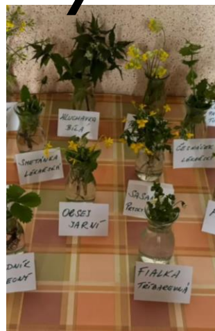
Dřeviny a rostlinky